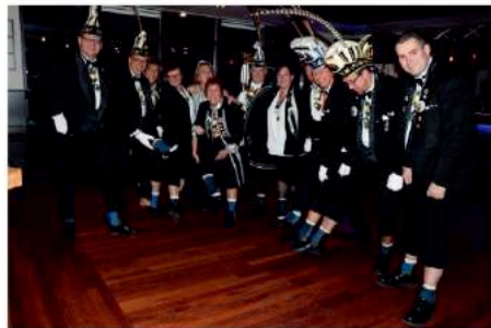
Stichting DCV steunt Alzheimer Nederland met ludieke actie.